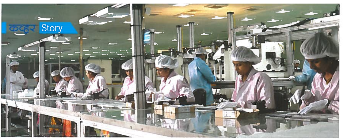
सोलार फोटो व्होल्टीक संशोधन प्रकल्प, जैन एरिगेशन जळगाव.

संशोधनाच्या पातळीवरचं जे काम शासनाच्या स्तरावर होणं अपेक्षित आहे ते काम आजवर फारसं झालेलं दिसत नाही. त्यामुळेच प्रगत देशांच्या तुलनेत भारत मागे पडलेला दिसतो. त्याला पुढे आणण्याचं काम जैन उद्योग समूहासारख्या संस्था करताना दिसतात.